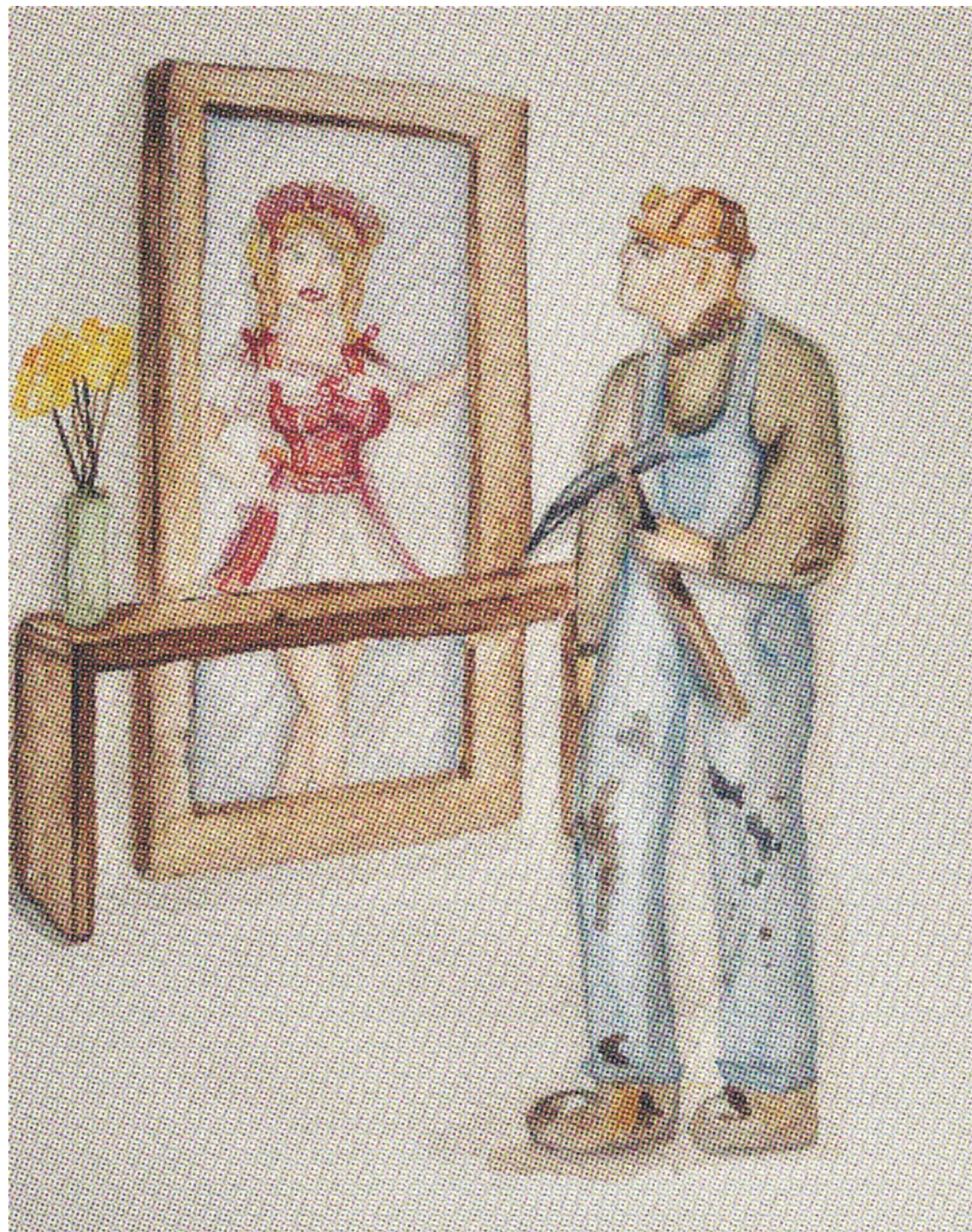
Проблема немецкого энергоповорота упирается в угольную промышленность, от которой экономика и профсоюзы не намерены отказываться, а модернизировать электростанции, работающие на угле, – дорого.